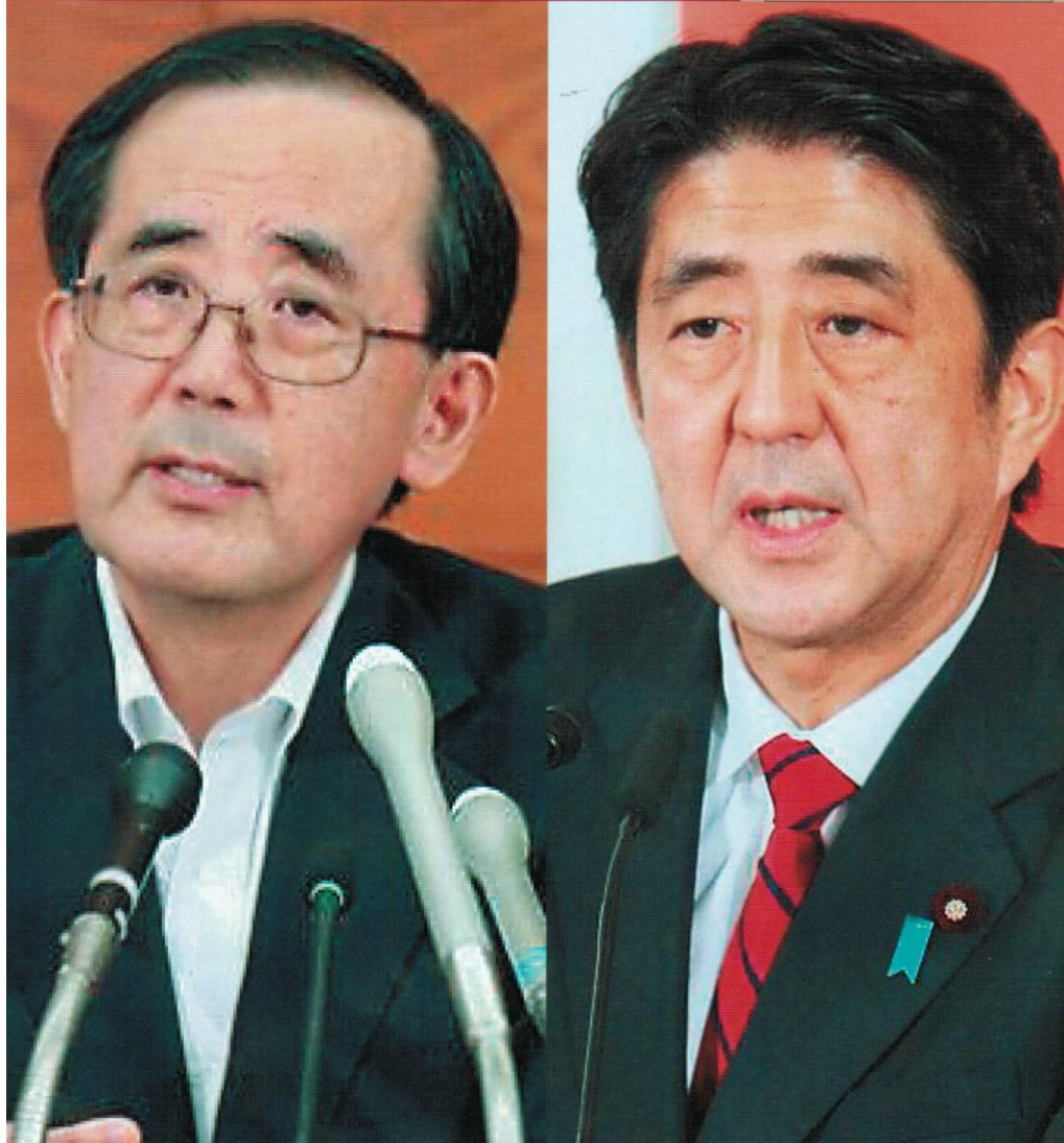
表紙の人 安倍晋三内閣総理大臣(右)と白川方明第30代日本銀行総裁